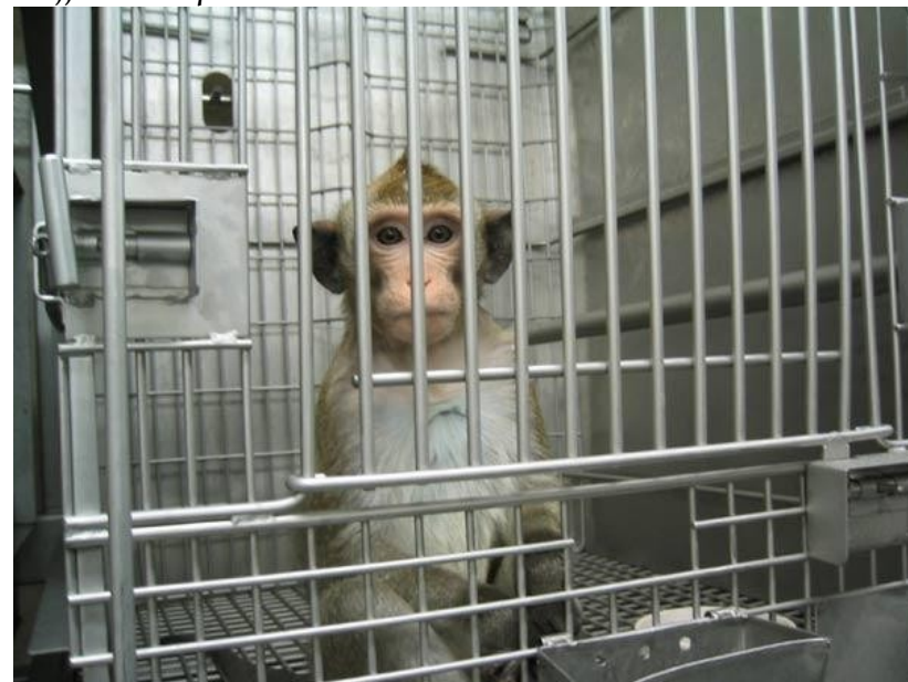
Macaque en surplus envoyé au labo

Les faits relatés ci-dessous impliquent principalement les zoos de Grande Bretagne. Mais tout porte à croire que ces pratiques sont également répandues dans le reste de l'Europe et du monde. Notons également que la plupart des griefs adressés aux zoos par le présent document valent bien évidemment pour les delphinariums 2 , où le taux de souffrance est plus élevé encore.