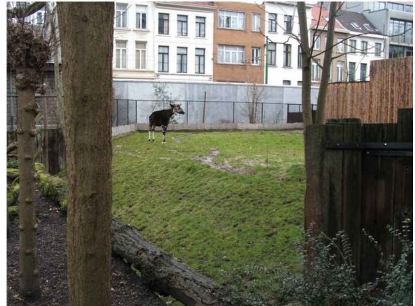
Une okapi au Zoo d'Anvers.

Elle décerne son accréditation sur base d'une inspection. Plus grave encore, la WAZA étant constituée par des professionnels de la communauté des zoos et des aquariums, elle a tout intérêt à maintenir et à encourager l'existence de telles institutions. Cette situation met intrinsèquement en conflit cette organisation avec les intérêts réels des animaux.