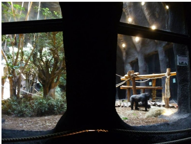
Gorille sous le volcan à Pairi Daiza

Le vrai visage de l'industrie de la captivité se dévoile quand elle monte en puissance. Elle traîne alors en justice ses contradicteur.euses, elle tient la presse sous son joug et entend imposer à tous sa seule vision du monde. On est prié de croire à ses mythes et répéter après elle que les zoos sauvent la nature sauvage en exhibant des enclos pandas, éléphants, rhinocéros ou gorilles, dont certains sont prélevés dans leur habitat d'origine, et en sensibilisant le grand public aux périls qui les menacent. Car derrière ces jardins riants d'une biodiversité sous cloche, la machine doit faire du profit.