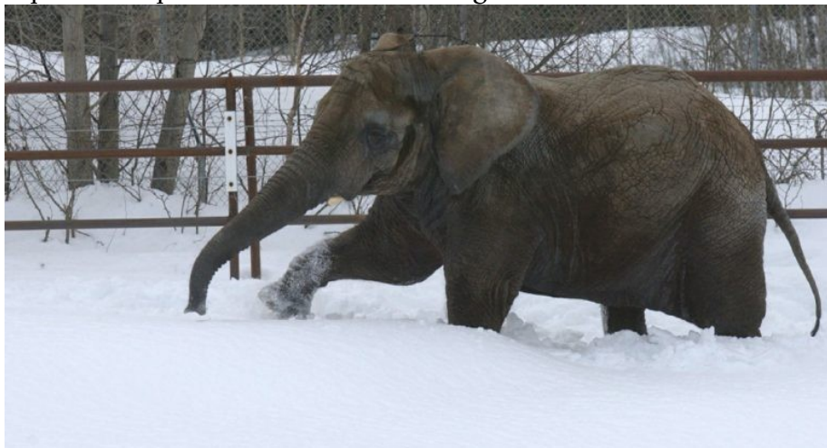
Maggie en 2004, avant son transfert dans un sanctuaire arboré en Californie

Après de nombreux débats et plus d'une alerte à propos de sa santé, l'effondrement de l'éléphant, Maggie a été libérée et vit maintenant au refuge de Performing Animal Welfare Society en Californie, où elle a rapidement retrouvé force et bien-être. Elle vit là-bas avec d'autres éléphants et reçoit divers aliments nutritifs, de bons soins médicaux et un traitement pour ses problèmes de santé. Elle aime marcher sur les hectares et les hectares de son immense habitat verdoyant, plus proche de son Afrique natale que de son enclos à Anchorage.