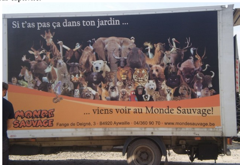
Camion publicitaire au Monde Sauvage d'Aywaille.

En outre, toutes ces lois, traités et directives ne prennent jamais en compte l'hypothèse que les zoos et les parcs marins pourraient être intrinsèquement préjudiciables aux animaux. Aucune réglementation ne laisse entendre que la pertinence de la captivité elle-même devrait être mise en question. Les animaux sont donc très seuls face aux impératifs des organisations de contrôle ayant un intérêt financier dans le maintien de leur captivité.