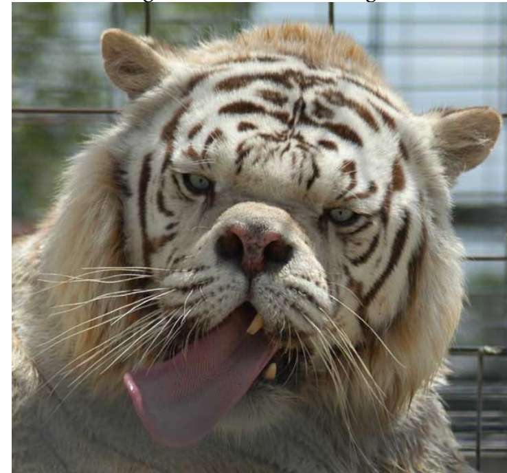
Tigre blanc victime de la consanguinité imposée par les zoos.

Nous pensons qu'en Grande Bretagne, la réduction de ce « pool génétique » a conduit à la naissance de jeunes léopards gravement frappés de difformités congénitales. Voir aussi : le tigre blanc 6