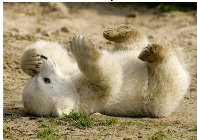
Knut, ours polaire vitrine d'un zoo de Berlin

En 1991, 25 lions d'Asie naquirent dans plusieurs zoos du monde. 22 d'entre eux moururent peu après. La même année, 166 naissances de panthères furent enregistrées dans les zoos. 112 d'entre ces animaux sont morts. Knut 4 vient de mourir à 4 ans en mars 2011, alors que les ours polaires sont supposés vivre trente ans et plus !