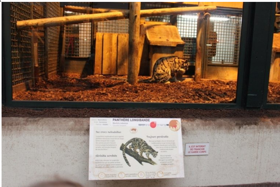
Panthere longibande au Jardin des Plantes à Paris.

Les zoos créent un sentiment de sécurité illusoire quant à la survie et au bien-être des animaux. Un zoo rempli de cages vides pourrait être une façon plus réaliste de transmettre le message d'une destruction imminente des espèces.