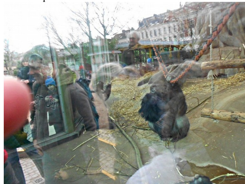
Visiteuses et gorille au zoo d'Anvers. Elleux dehors, lui dedans...

n'existe aucune preuve que cette « médecine douce » soit capable de traiter quelque trouble que ce soit.