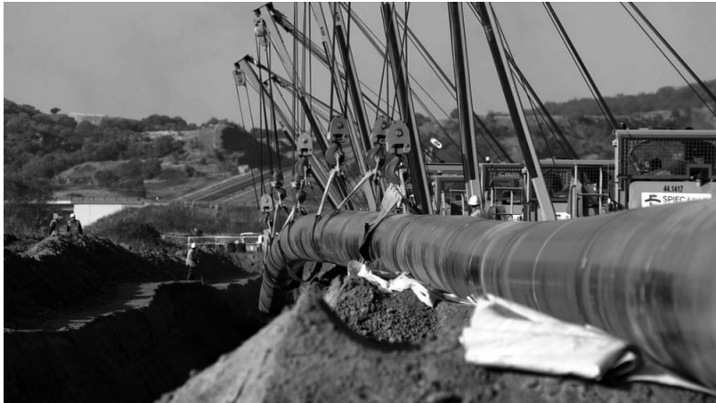
Travaux du TAP en Grèce septentrionale, novembre 2016