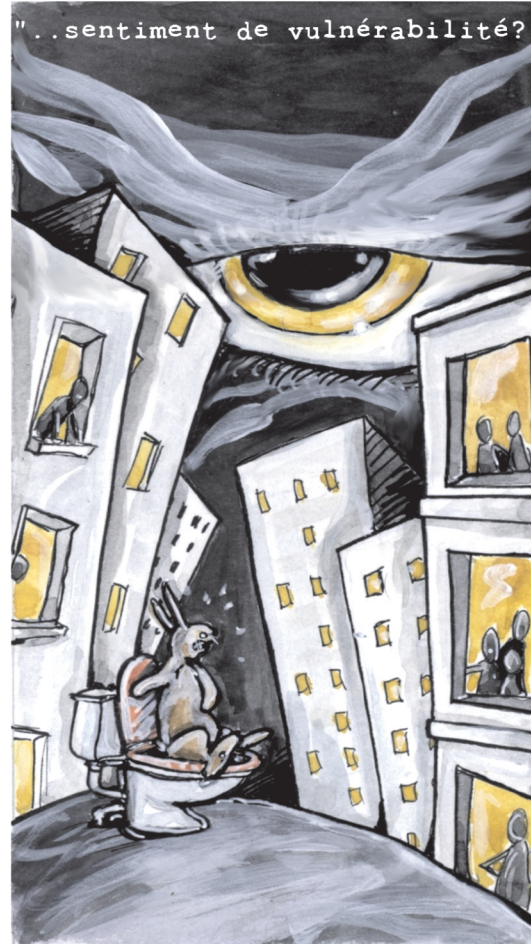
"...sentiment de vulnérabilité?"