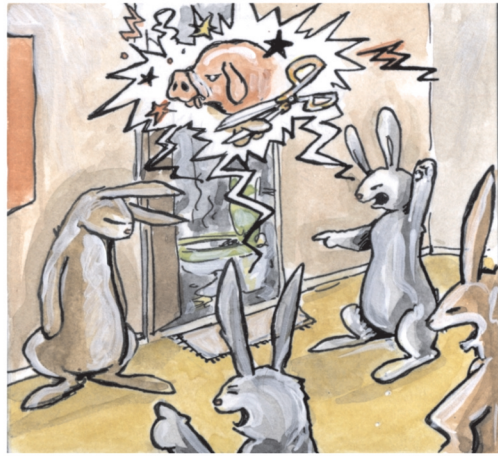
"...et puis on m'a expliqué..."