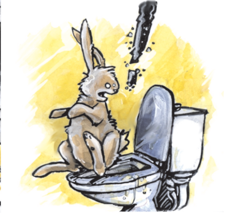
"...en fait en essayant on comprend très vite pourquoi il vaudrait mieux que chacun s'assoie..."