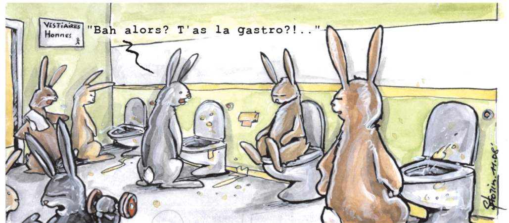
"Bah alors? T'as la gastro?!..."