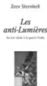
Le regard - Espace de politique

Pour eux, en plus de la Providence, la société doit être bâtie sur des préjugés. Loin de les condamner comme le font les Lumières, les anti-Lumières leur reconnaissent une valeur de premier plan. Selon Taine, chaque génération n'est que « la géranie temporaire et la dépo-