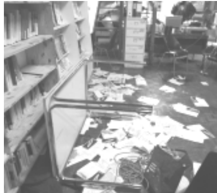
le lieu après le passage des racialistes

Face à la patience des participants au débat, nos racialisateurs paternalistes