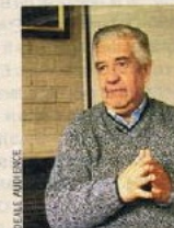
Le général Manuel Contreras. Ex-chef de la police secrète de Pinochet, il affirme avoir été aidé par la DST dans sa traque des réfugiés chiliens.

l'impunité des bourreaux. Cet été, en Argentine, le président Nestor Kirchner a abrogé le décret interdisant l'extradition des criminels de la dictature (nombre d'entre eux sont réclamés par l'Espagne et la France), le pays a adhéré à la convention internationale qui rend imprescriptibles les crimes de guerre et contre l'humanité, et les députés argentins ont voté l'annulation des lois d'amnistie adoptées en 1986 et 1987. Les poursuites ne s'en trouveront pas forcément relancées, mais c'est déjà un progrès. Marie-Monique Robin a mis ses rushes à la disposition du journaliste argentin Horacio Verbitsky, pour une éventuelle utilisation lors des procédures à venir.