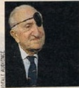
Le général Paul Aussaresses. Tortionnaire avéré en Algérie, il a enseigné son « savoir-faire » aux Etats-Unis, où se sont formés les militaires latino-américains.

Si les familles des victimes doivent encore réclamer justice, le vent commence à tourner en ce qui concerne