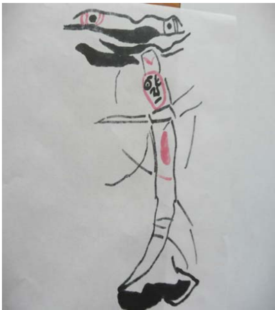
Le massacre du printemps

Dans le douzième numéro de la revue Internationale situationniste daté de septembre 1969, un texte intitulé Préliminaire sur les conseils et l'organisation conseilliste envisage de donner une assise théorique aux formes de lutte qui ont surgi en 1968 2 . Après un historique des organisations conseillistes, formes d'organisation autonomes et anti-autoritaires, le texte tente une réactualisation du conseillisme à la faveur de mai 68. Il insiste sur la nécessité de dépassement de la forme organisationnelle pour en faire l'espace unique où doit se concentrer le pouvoir démocratiquement et collectivement constitué.