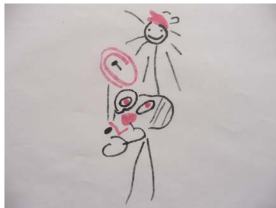
Le retour de la conscience

marque pas la fin du mouvement, que les luttes ouvrières qui d'ailleurs ne manquèrent pas de se déclencher dans les années qui suivirent tirent profit de l'expérience de 68 et que le feu prenne à nouveau. Le conflit de l'usine Lip de Besançon en 1973 reste l'exemple le plus connu de ce que craignait le pouvoir, c'est-à-dire que des ouvriers, dans le prolongement des idées et pratiques inaugurées en 68, s'émancipant pour partie de la tutelle des confédérations syndicales, développent de nouvelles formes de lutte et