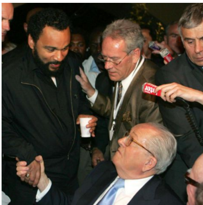
Dieudonné serrant la main à Jean-Marie Le Pen

Pour le marchand de haine, la Shoah est une "pornographie mémorielle" et c'est parce qu'il dénonce "la domination de la Shoah sur les autres mémoires" qu'il est attaqué, à tort selon lui, d'antisémitisme par le fameux "lobby juif". Pour défendre cette théorie qui voudrait "qu'on parle trop de la Shoah" il invite Robert Faurisson, célèbre négationniste, sur la scène d'un de ses spectacles. Pour étayer cette thèse il s'appuie également sur Alain Soral ou Jean-Marie Le Pen - d'ailleurs parrain d'un de ses enfants.